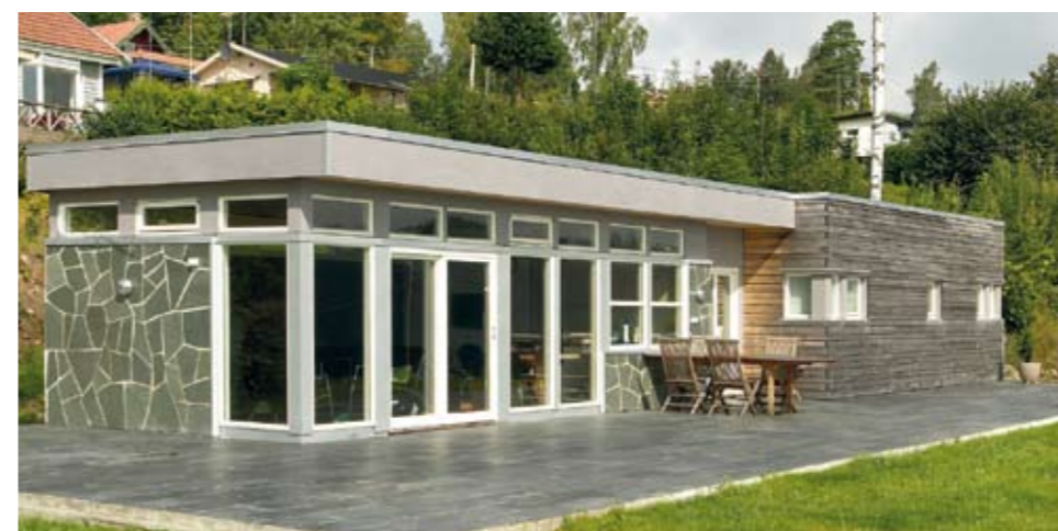
Med skyvedørene i glass kan store deler av stua åpnes ut mot terrassen.

Sommerstid er familien på hytta så ofte de kan. Med nærheten til sjøen, til strender og båtliv, ser de ingen grunn til å reise noen andre steder.