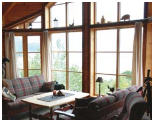
Den flotte utsikten over fjorden kan nytes fra både terrassen og stua.