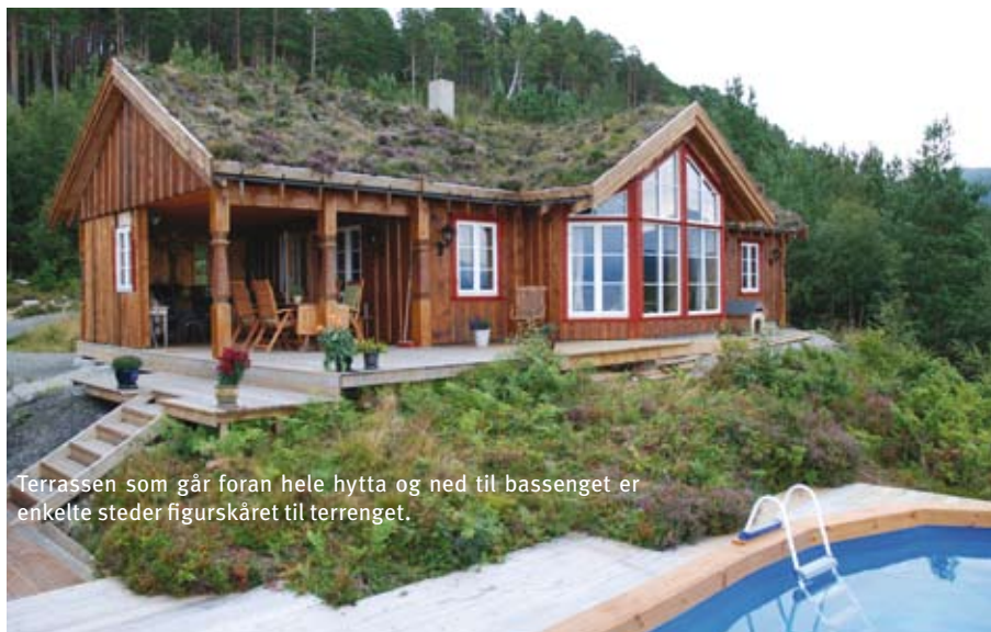
Terrassen som går foran hele hytta og ned til bassenget er enkelte steder figurskåret til terrenget.