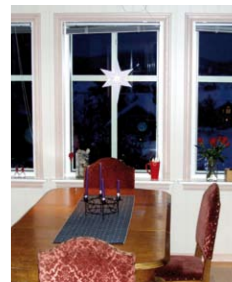
Adventsstemming i allrommet.